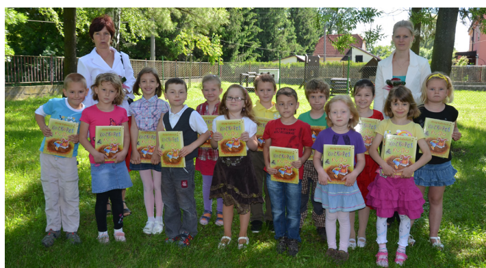
Loučení s MŠ 2013