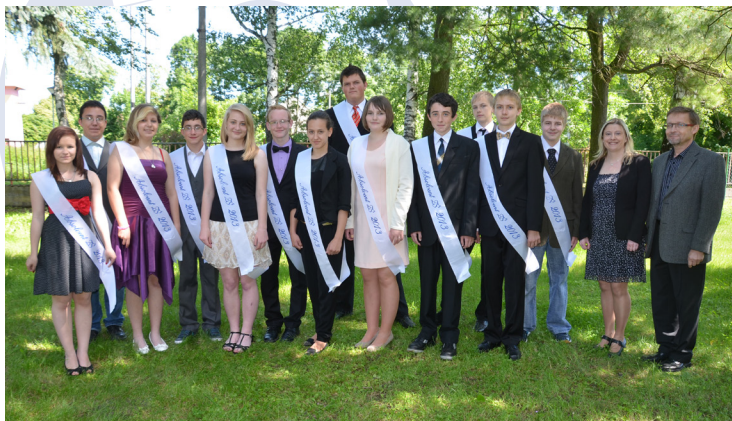
Loučení žáků 9. třídy