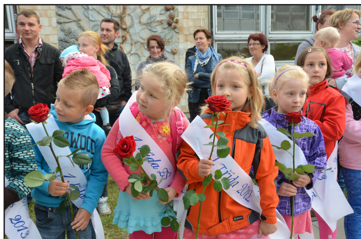
První školní den