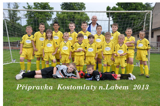
Přípravka Kostomlaty n.Labem 2013